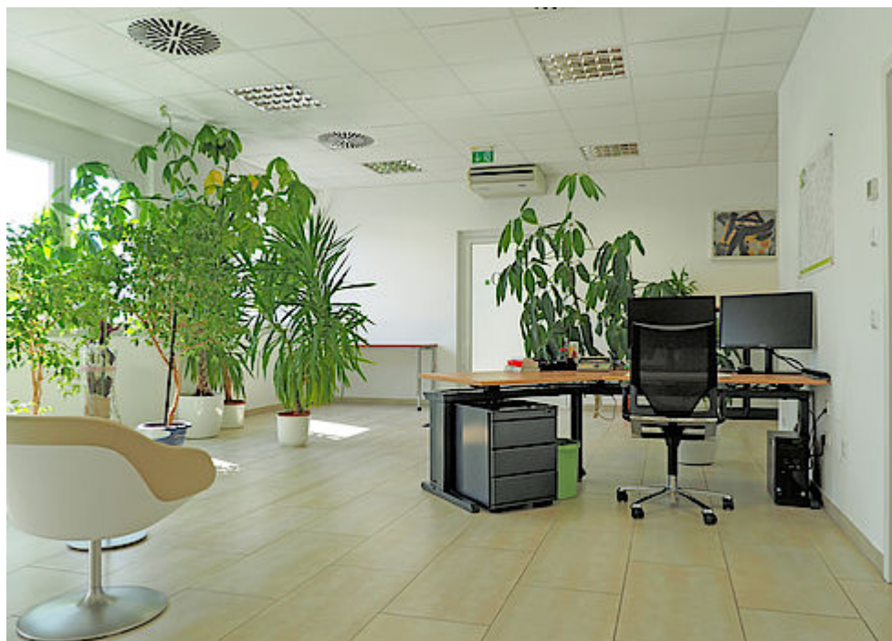
Büro / Empfang